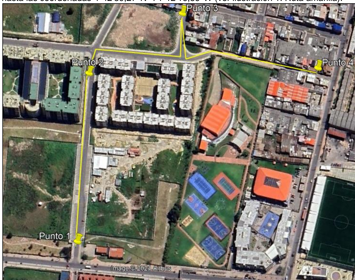
Ilustración 1. Recorrido verificación ambiental

Con base en lo anterior, el día 11 de octubre de 2024 se realizó recorrido de control y vigilancia en el barrio México desde las coordenadas 4°42'42,948"N- 74°12'29,214"W hasta las coordenadas 4°42'39,27"N- 74°12'16,86"W (ver ilustración 1. Ruta amarilla).